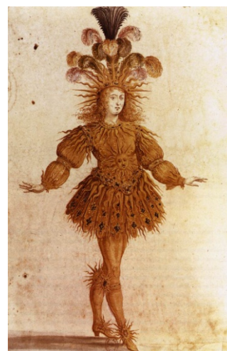
Królewski Balet Nocy. Ludwik XIV w roli Słońca.

1.5. Wielkie inwestycje królewskie: Wersal, Kościół Inwalidów w Paryżu, Plac Vendome).