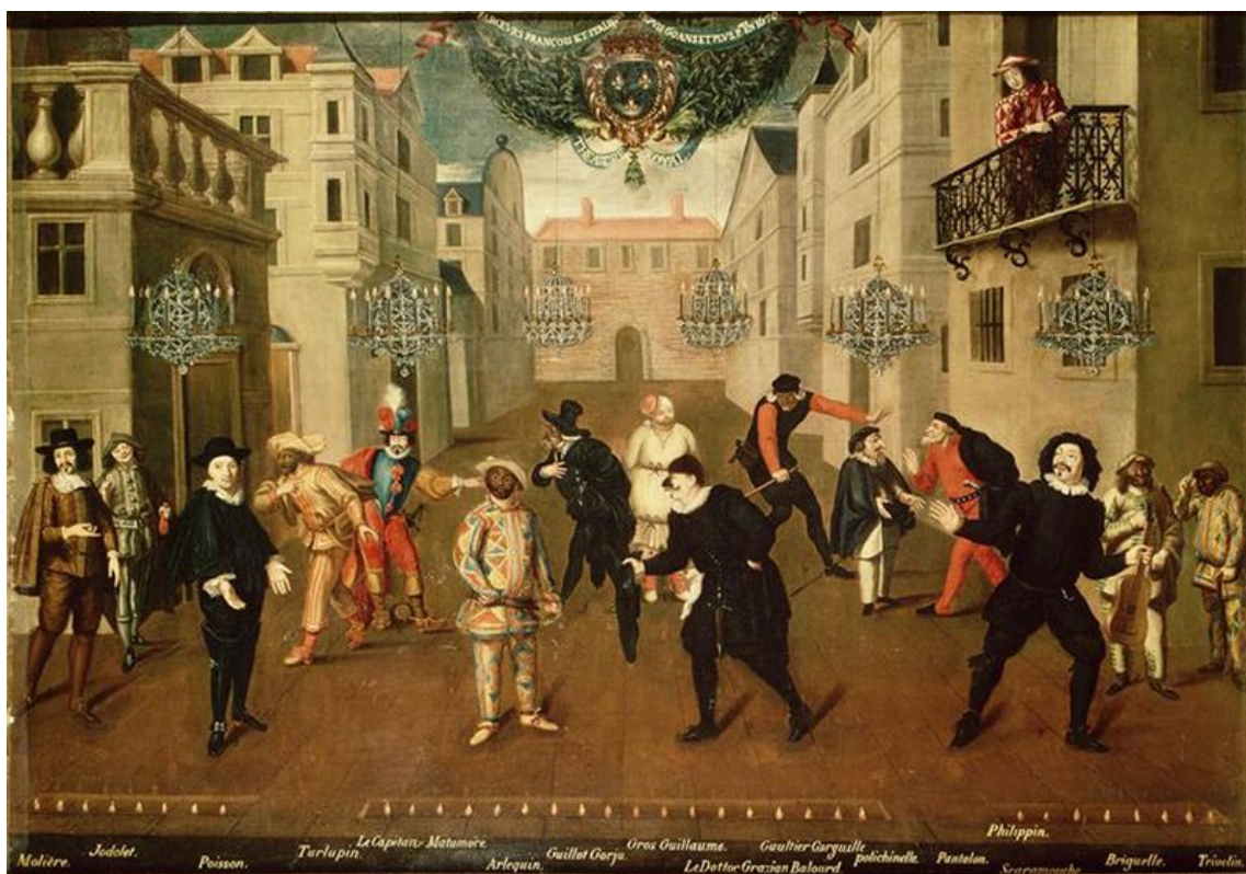
Trupa Moliera (ok. 1670). Komediodpisarz pierwszy z lewej.

https://www.youtube.com/watch?v=B_7GyOkIUTI